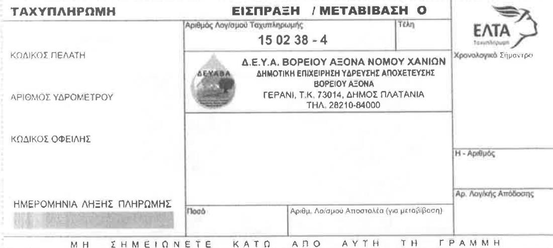
Εικόνα 3: εμπρόσθια όψη εντύπου λογαριασμού - Δείγμα 3